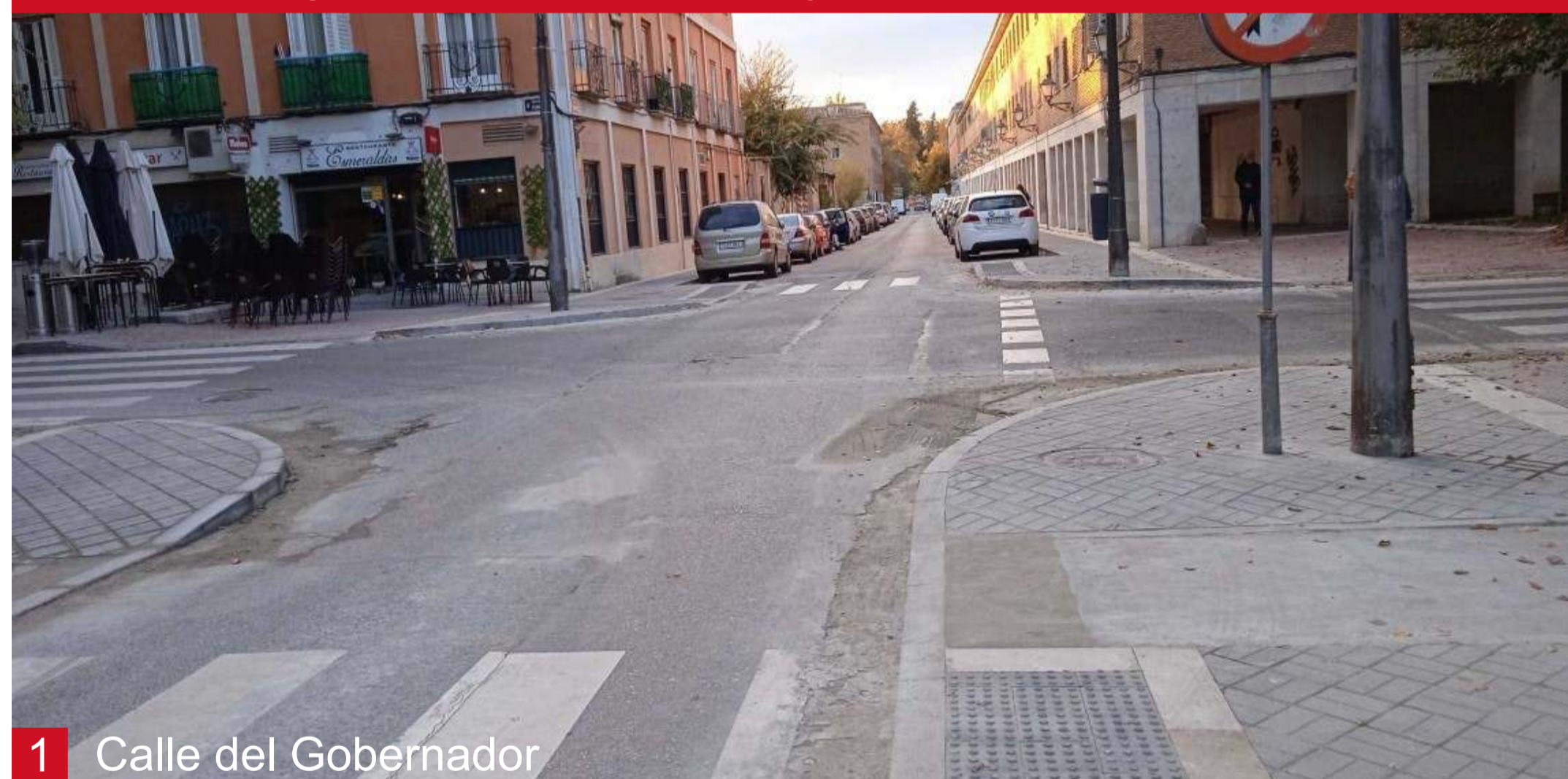
1 Calle del Gobernador