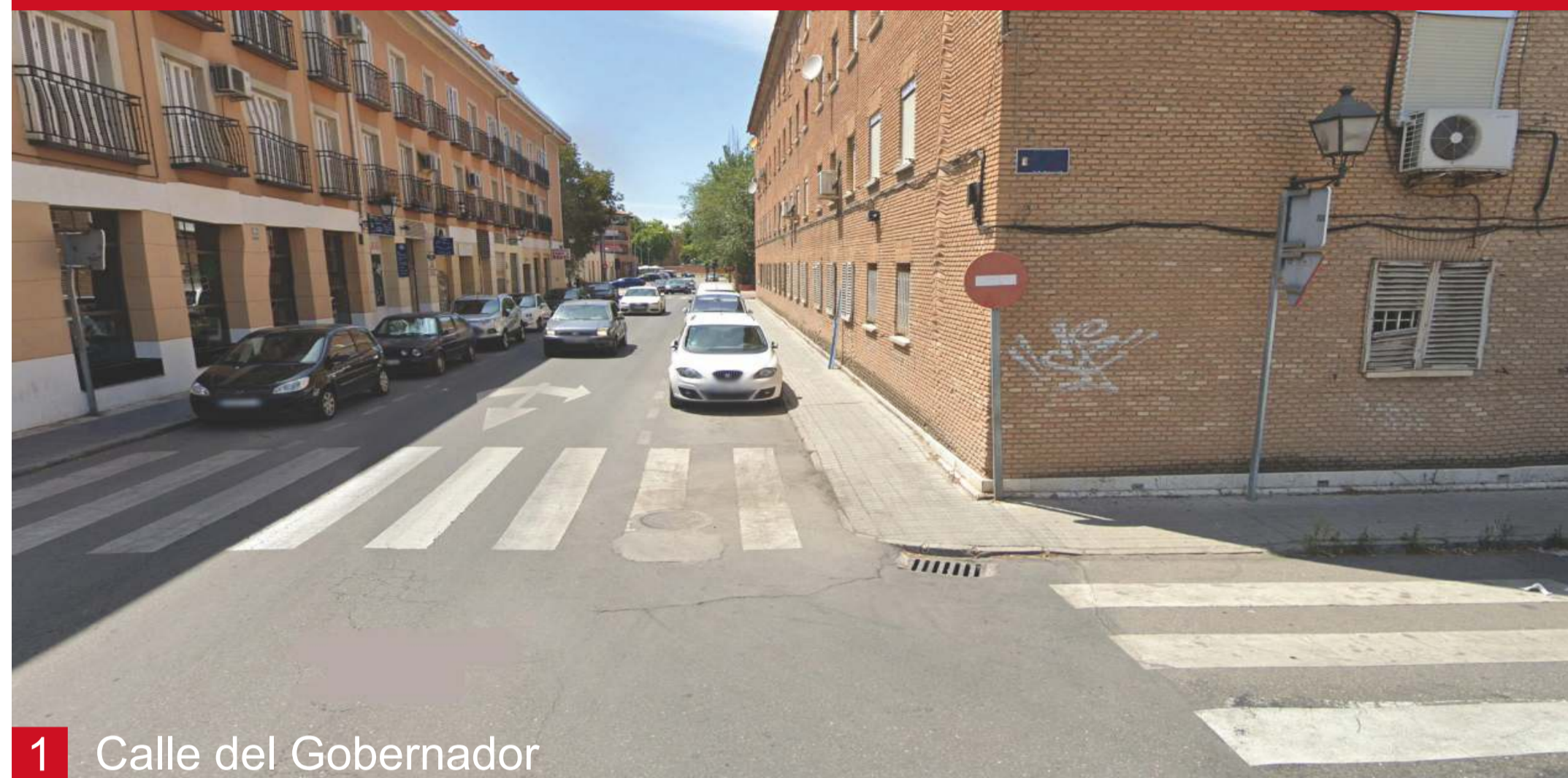
1 Calle del Gobernador