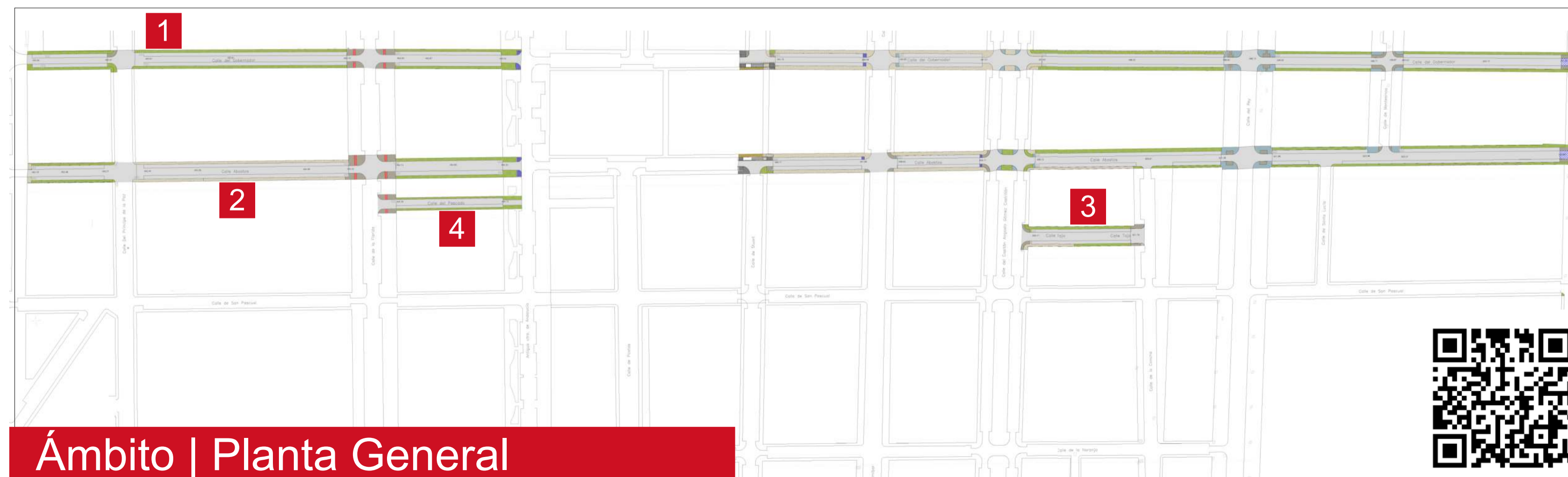
Ámbito | Planta General