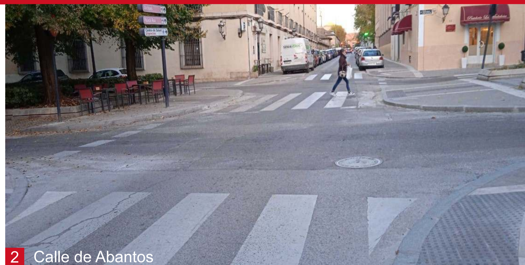
2 Calle de Abantos