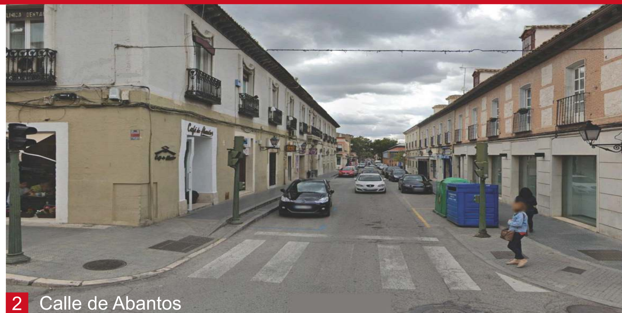
2 Calle de Abantos